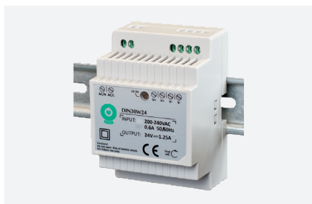
MPL-24VDC-DIN30W (30 W)