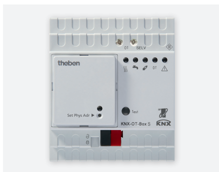
KNX-OT-BOX S 8559201