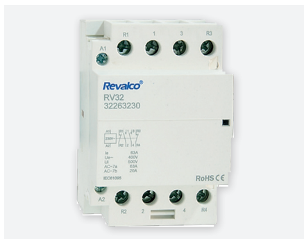
RPC63A3, 3 modules - 63 A