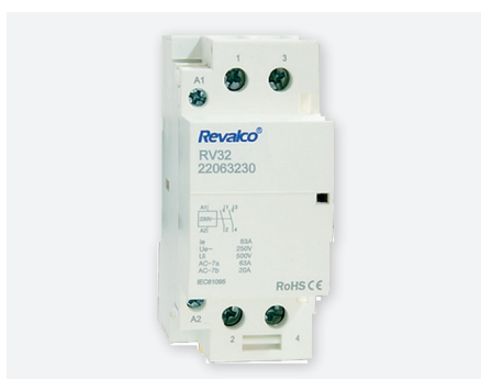
RPC63A2, 2 modules - 63 A