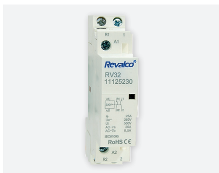
RPC25A1, 1 module, 25 A