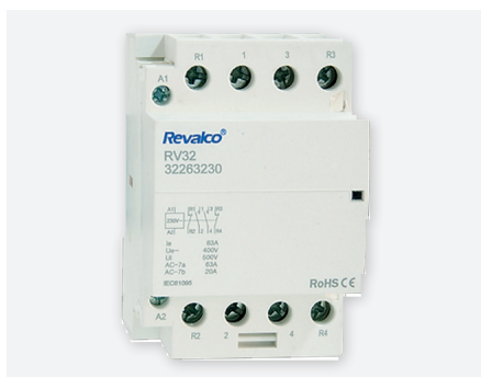
RPC63A3, 3 modules - 63 A