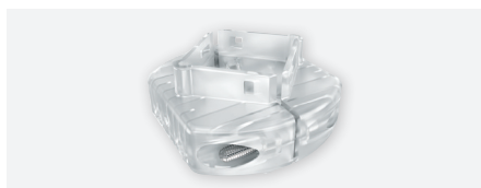
907.0.928, fixation sur mât station météo