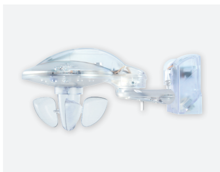
METEODATA 140 S 24V KNX