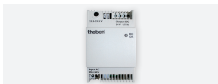
907.9.330, alimentation 24 V DC