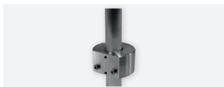
907.0.925, fixation sur mât WML1