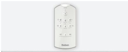
theSenda B, télécommande avec App theSenda Plug