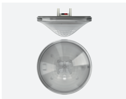
thePrema P360 KNX UP GR