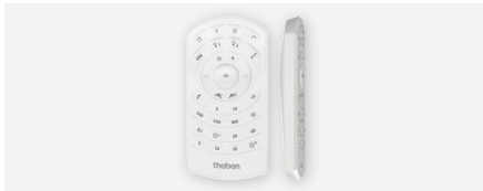
theSenda P, télécommande de service