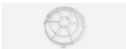
907.0.531, grille de protection