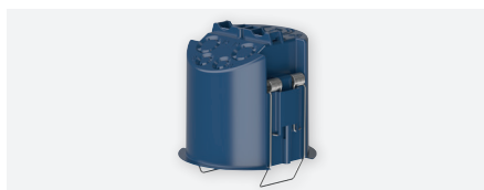
907.0.992, boîtier de montage au plafond 68A