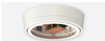
Set basic KNX AP Multi WH, kit de rénovation