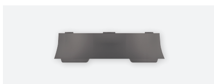
FRAME 110B GR 9070919, boîtier pour montage apparent