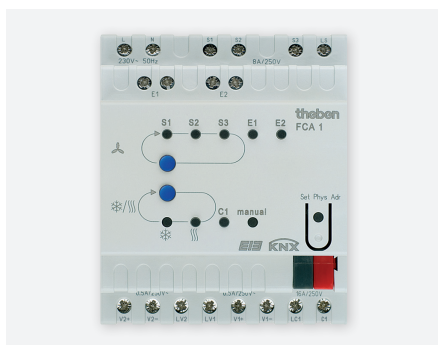
FCA 1 KNX