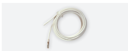
907.0.321, capteur de température sol