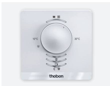
RAM718 P KNX