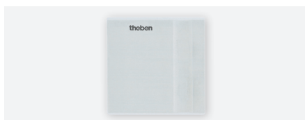
907.0.459, temperatuurvoeler IP65