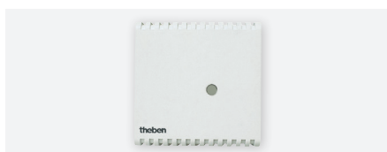
907.0.191, ruimtevoeler (niet instelbaar)