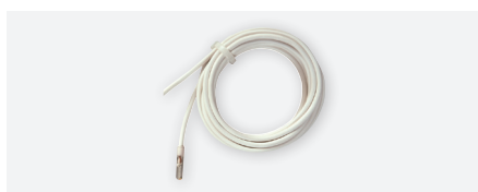
907.0.321, sensor voor vloertemperatuur