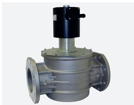
EVG 230 NCA DN 050