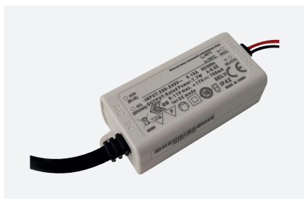
ID229201ZZZ (7 W)