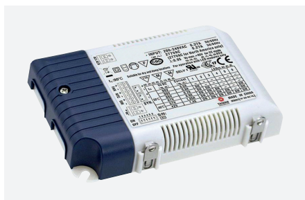
ID499108ZZZ (25 W - TRIAC)