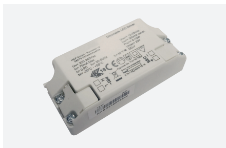
ID499105ZZZ (10 W - TRIAC)