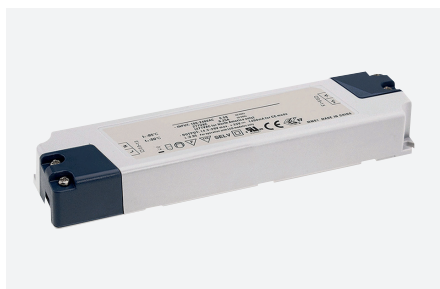
ID229209ZZZ (25 W)