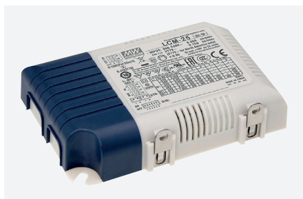
ID229207ZZZ (18 of 25 W - 0-10 V)