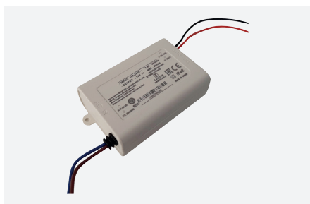
ID229205ZZZ (24 W)