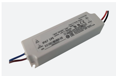
ID229203ZZZ (16 W)