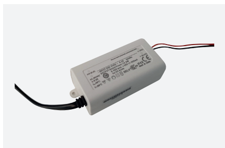
ID229202ZZZ (12 W)