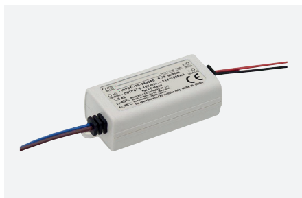
ID229200ZZZ (8 W)