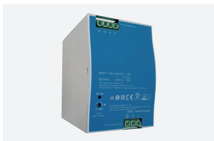
ID229508ZZZ (480 W - PFC - rail DIN)