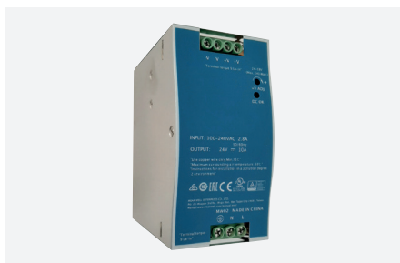
ID229507ZZZ (240 W - PFC - rail DIN)