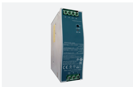
ID229506ZZZ (150 W - rail DIN)