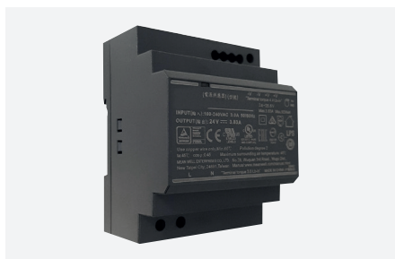
ID229505ZZZ (100 W - rail DIN)