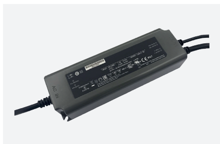
ID229403ZZZ (120 W - PFC - 0-10 V)