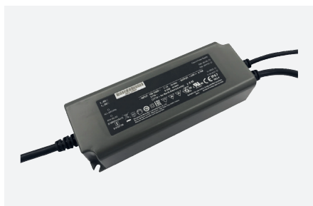
ID229402ZZZ (90 W - PFC - 0-10 V)