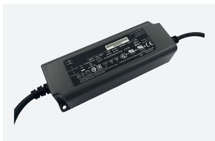
ID229401ZZZ (60 W - PFC - 0-10 V)