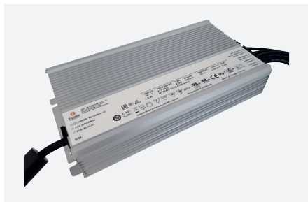
ID229061ZZZ (600 W - PFC)