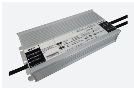
ID229060ZZZ (480 W - PFC)