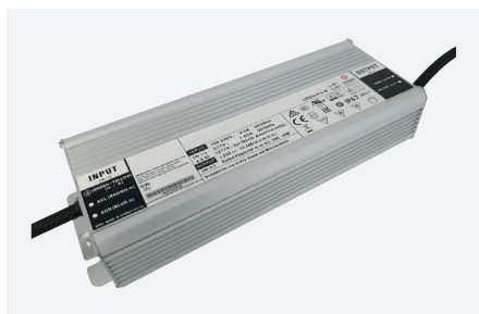
ID229049ZZZ (320 W - PFC)