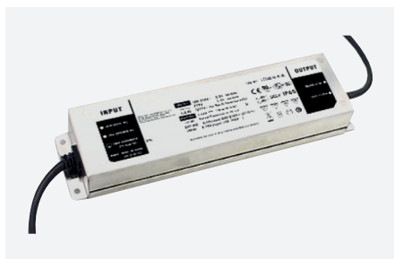
ID229047ZZZ (200 W - PFC)