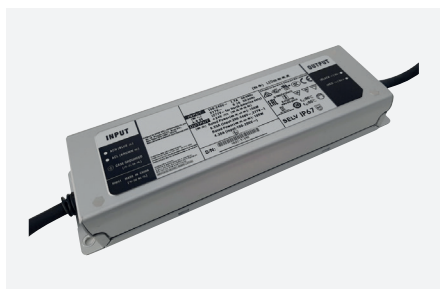
ID229046ZZZ (150 W - PFC)