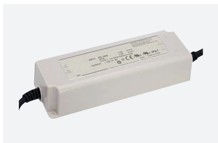
ID229050ZZZ (150 W)