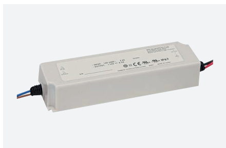
ID229045ZZZ (100 W)