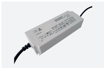
ID229102ZZZ (90 W - PFC)