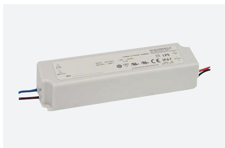
ID229043ZZZ (60 W)