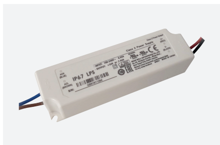
ID229040ZZZ (20 W)