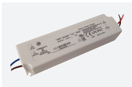
ID229042ZZZ (35 W)