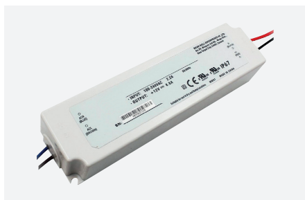
ID229044ZZZ (100 W)