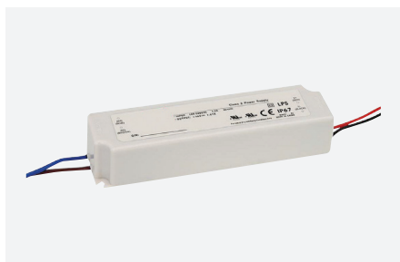
ID229041ZZZ (60 W)