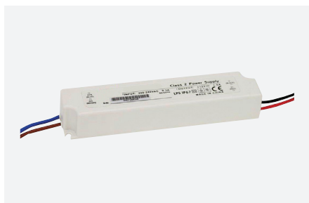
ID229038ZZZ (18 W)