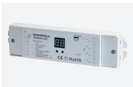
ID836301ZZZ (4 adresses DALI)