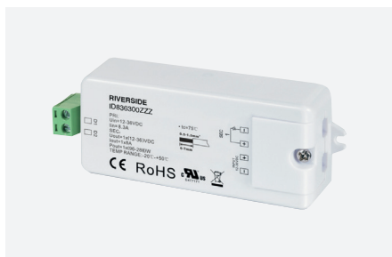
ID836300ZZZ (1 adresse DALI)