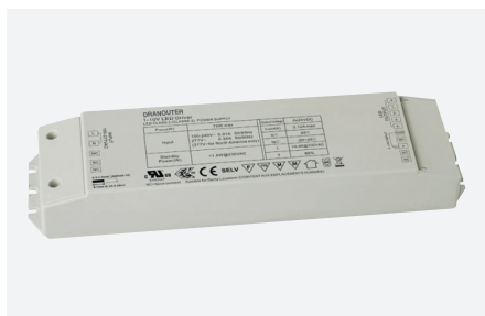
ID839001ZZZ (ontvanger - 75 W)