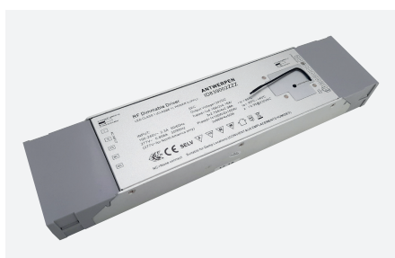
ID839002ZZZ (ontvanger - 200 W)