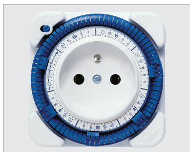
TT26W, programmation 7 jours

La prise programmable analogique (ou chronoprogrammateur) est prévue pour un montage directement dans une prise de courant 230 V et convient pour la commande de tout appareil électrique de maximum 3500 W. La programmation s'effectue à l'aide de segments basculants.