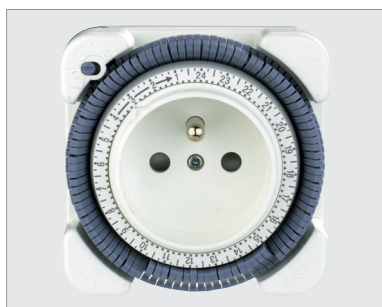
TT 26, programmation 24 heures