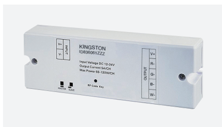
ID836061ZZZ (ontvanger - RGB+W)