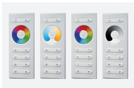
ID836356BZZ (zender - RGB) ID836357BZZ (zender - tweekleurig) ID836358BZZ (zender - RGB+W) ID836359BZZ (zender - monochroom)