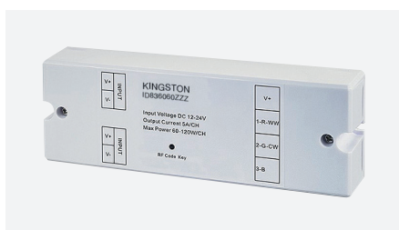
ID836060ZZZ (ontvanger - RGB, tweekleurig, monochroom)