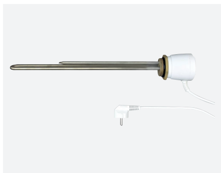
ELIW082N | ELIW083N