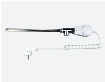
ELIW033 | ELIW035