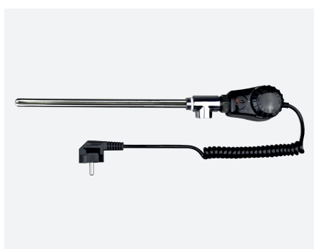
ELIW033Cz | ELIW035Cz