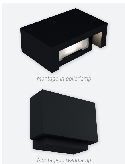
IDTL941051NSC (gestructureerd zwart)