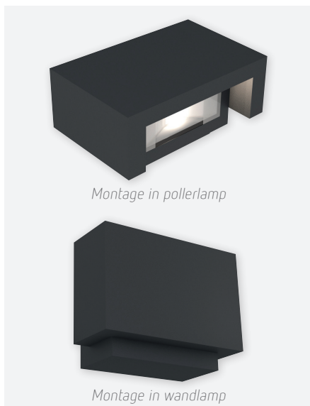
ID941050FSC (gestructureerd antraciet grijs)