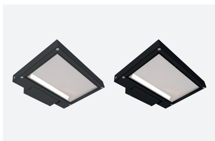
Asymmetrische - 30 W - Hoek: 48° ID571255FSC (gestructureerd antraciet grijs) ID571257NSC (gestructureerd zwart)