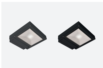
Symmetrische - 12 W - Hoek: 90° ID571251FSC (gestructureerd antraciet grijs) ID571252NSC (gestructureerd zwart)