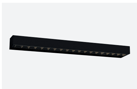
ID571620NSC (15 W - angle: 75°)