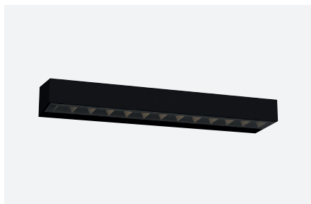
ID571610NSC (10 W - angle: 75°)