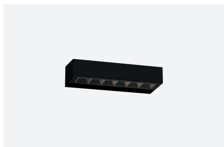
ID571600NSC (6 W - angle: 90°) ID571604NSC (2 x 6 W - angle: 2 x 90°)