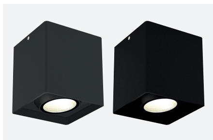
ID941001FSC (gestructureerd antraciet grijs) ID941002NSC (gestructureerd zwart)