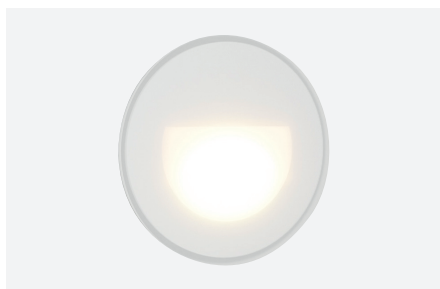
ID498191BZZ (ronde afdekplaatje - wit glas)